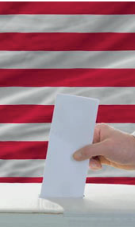
Candidatos seducidos por la arrogancia y la soberbia