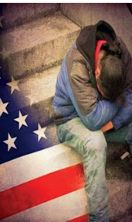
Una sociedad profundamente dividida

Desde el asesinato de John F. Kennedy, los Estados Unidos dejaron de promover la política pro desarrollo y pro industrial para sus vecinos de América Latina. La presidencia pasó progresivamente a una élite ligada a las finanzas internacionales, aniquilaron la propuesta de industrialización mundial acelerada, y se mudaron a un modelo económico maquilador globalista.