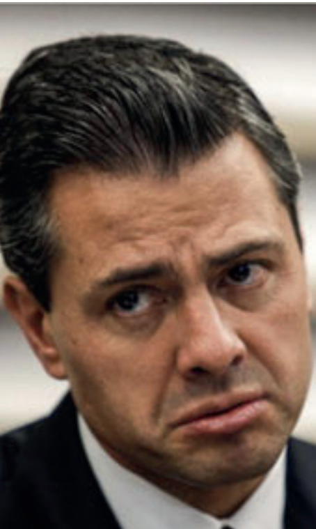
Cinismo, complicidad y alta corrupción

En estos días de discusión del Paquete Económico, el presidente Enrique Peña justifica el ajuste y recorte en el gasto para el próximo año por 239 mil millones de pesos que afectará a muchos programas sociales. La aplicación de estos criterios de austeridad por años, no es un asunto coyuntural, es una práctica sistemática en contra de una población empobrecida configurando un modelo de insanidad económica.